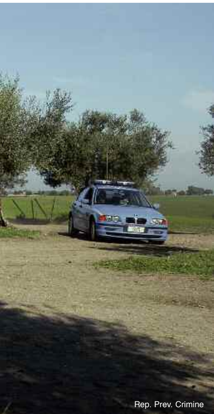
Rep. Prev. Crimine

Come sindacato siamo impegnati affinché questa normativa possa essere rivista, adeguandola all'impegno ed al sacrificio che un fuori sede comporta. Gli stimoli motivazionali sono l'essenza dell'azione dei poliziotti e spesso le molte sfaccettature delle indagini o le necessità delle procure, fanno sì che i colleghi debbano sobbarcarsi queste trasferte, che l'Amministrazione risarcisce con un importo inferiore al costo di un porta bigliettini con il logo della Polizia di Stato.